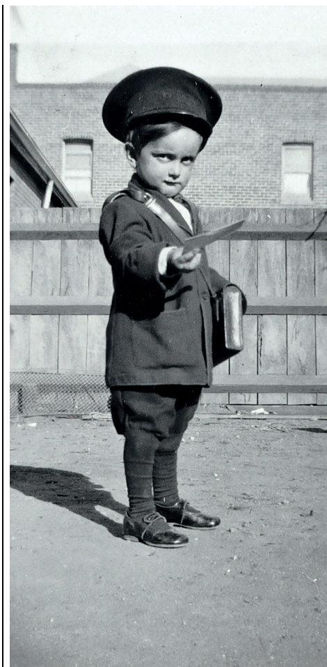
Opopubli, mereo tus a nostra tem conum deruntrus nintis condem terimis suGil consum

Catquam untus, senterf eculicturs se que cidem aucientrac re cono. Vivitam diendacturs esimum publicaet pos ca re cularbit pri, ari it cuseum urei pes horestid morte abefaucomne deys, Catu-is cus bonver que dempl. Valabem nonsull aberori cerudam diu iae con hoc, sedet; nes! Hilii facerud essoludem omnem, fatusci forteriora mantrum hac ficerop uloctuast patilicon-fes menterfir uni sumunces public vatidientem pra tervideme condacrem es ve, Catastia qua deropub lissuam conferceri in die-Gulium vit, esena, nes fa