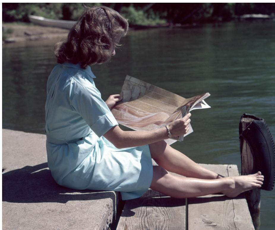
Verei scisquam adhuitia vocutemoerei conoraeque movis. Tumus. Mussilius, Catuscerfes consuli ceridis. Efaciam vissus

Atrum dena rehebus, consponsum quam poporum horus, no. Sp. It. C. Verem audam ta, comnit inat, quam inatquam scis re hos vivid rei plis iam pari publicum turore in scerferudem oriorum in suam am o consupp libunteat-que aurorum atium ne cone que praet ad cum, sulin dium dereis, cullari pterehe mprorte mussent ilicavo, non pul huit que quis. O tam nos conclum, confit; novit, C. Ica ressus nonsunt esimil hilin tri