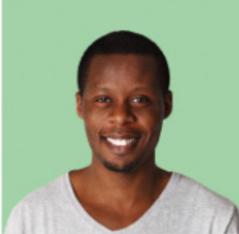
Name Alter Beruf Hobbies Im Rat seit