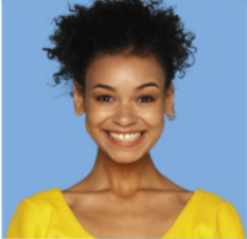
Name Alter Beruf Hobbies Im Rat seit