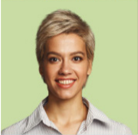
Name Alter Beruf Hobbies Im Rat seit