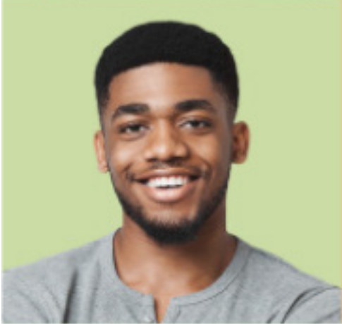
Name Alter Beruf Hobbies Im Rat seit