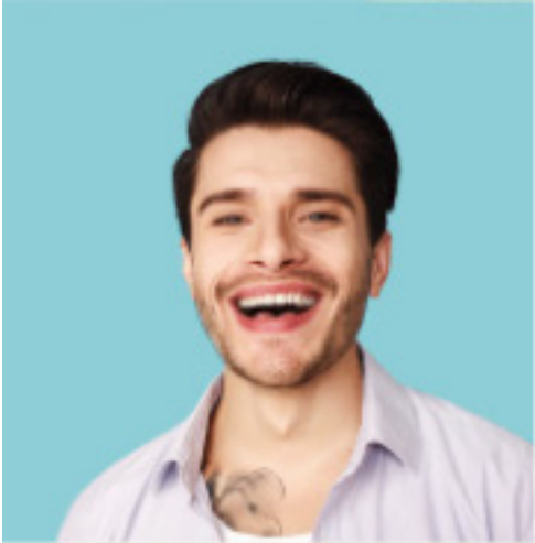
Name Alter Beruf Hobbies Im Rat seit