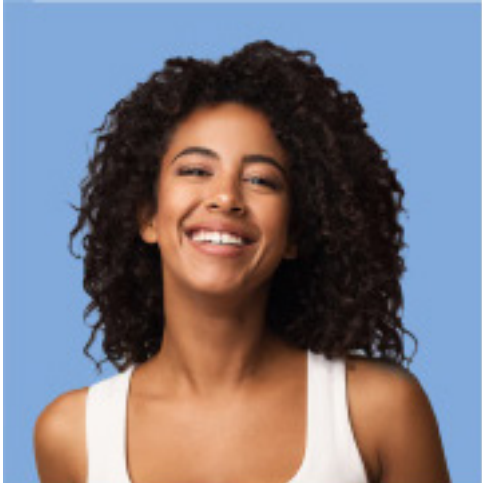
Name Alter Beruf Hobbies Im Rat seit