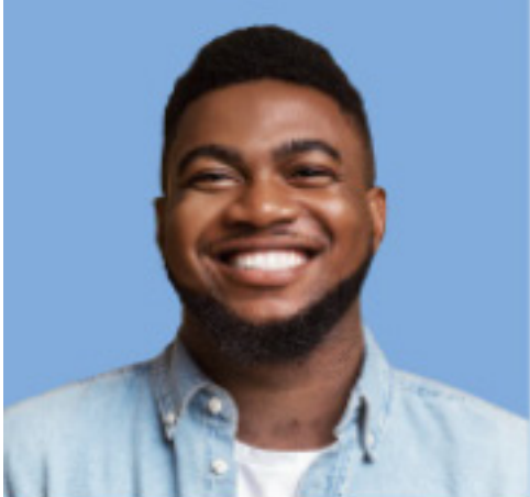
Name Alter Beruf Hobbies Im Rat seit